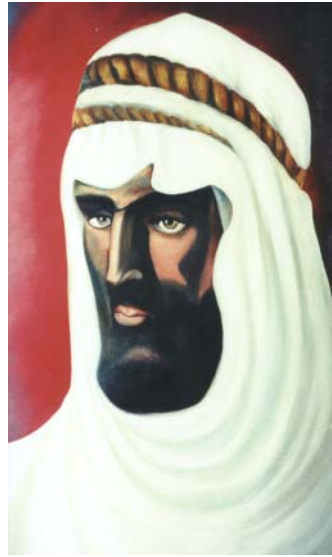
KALLABY SUFF HARAM

Glória a Deus nas Alturas Paz na Terra aos Homens de Boa Vontade } bis